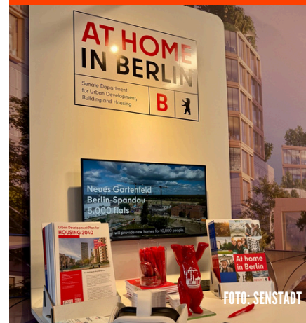
UNSER BERLINER MESSESTAND AUF DER MIPIM