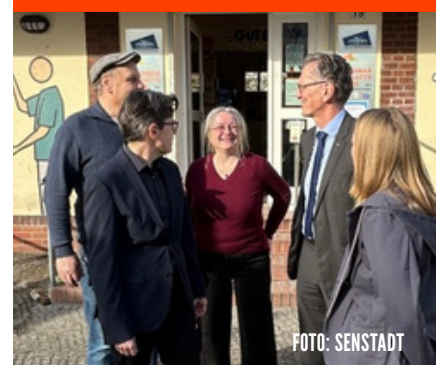
VOR DER MIETPREISPRÜFSTELLE AM MIERENDORFFPLATZ