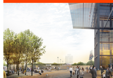
RANDERING DES EUROPAPLATZES