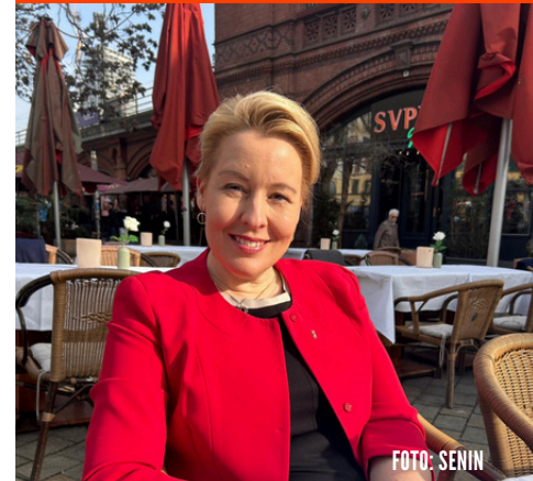
RÜCKENWIND FÜR DIE AUSSENGASTRONOMIE IN BERLIN